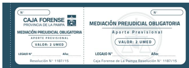
Talón de rendición